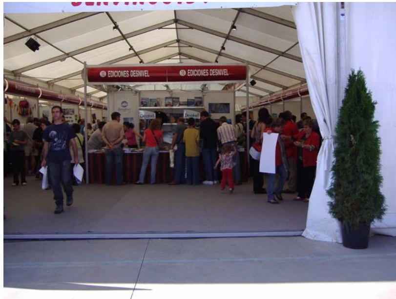
Vista de la carpa central

En definitiva i com hem dit en altres ocasions, aquesta fira ve a omplir un buit dins el panorama cultural i excursionista català i de la resta d'Espanya.