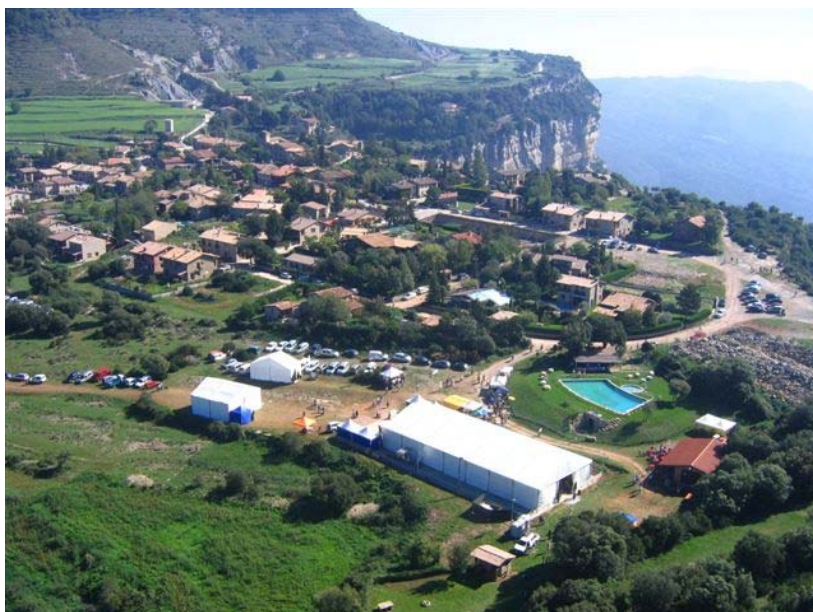
Vista aèria de la fira i el poble de Tavertet

Per la nostra part podem dir que estem satisfets del funcionament i dels resultats de la fira, així com del grau d'acceptació que han tingut entre el públic les activitats complementaries.